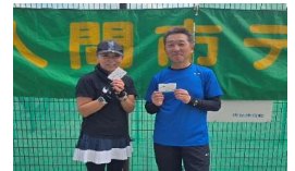
ベスト4 山口・アダムスペア