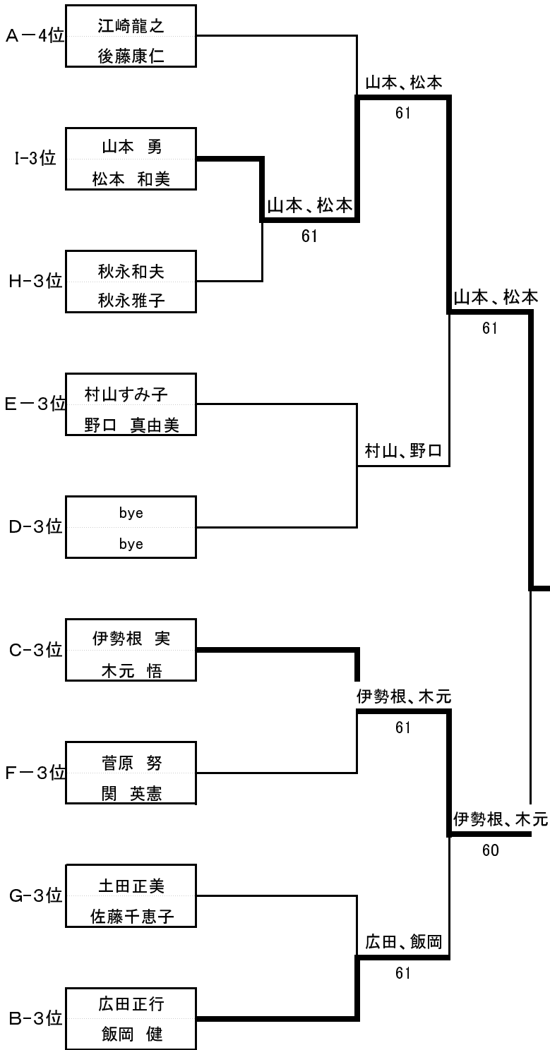
三位トーナメント