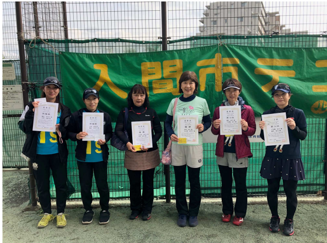
準優勝 鶴見・宮崎